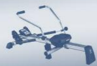
Fitness und Freizeit Leisure and Training equipment