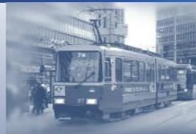
Fahrzeugindustrie Vehicle Industry